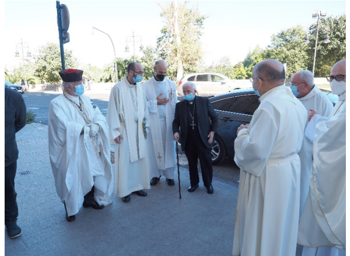
Los Sacerdotes concelebrantes y Autoridades esperando al Cardenal