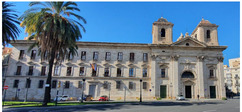
Iglesia de Santa María de Montesa llamada del Temple